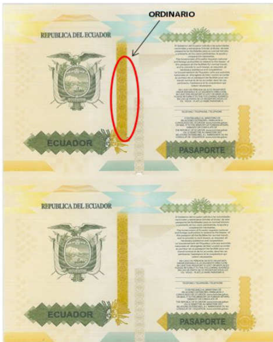
Imagen 2. Ubicación de la palabra ORDINARIO en la contratapa anterior.