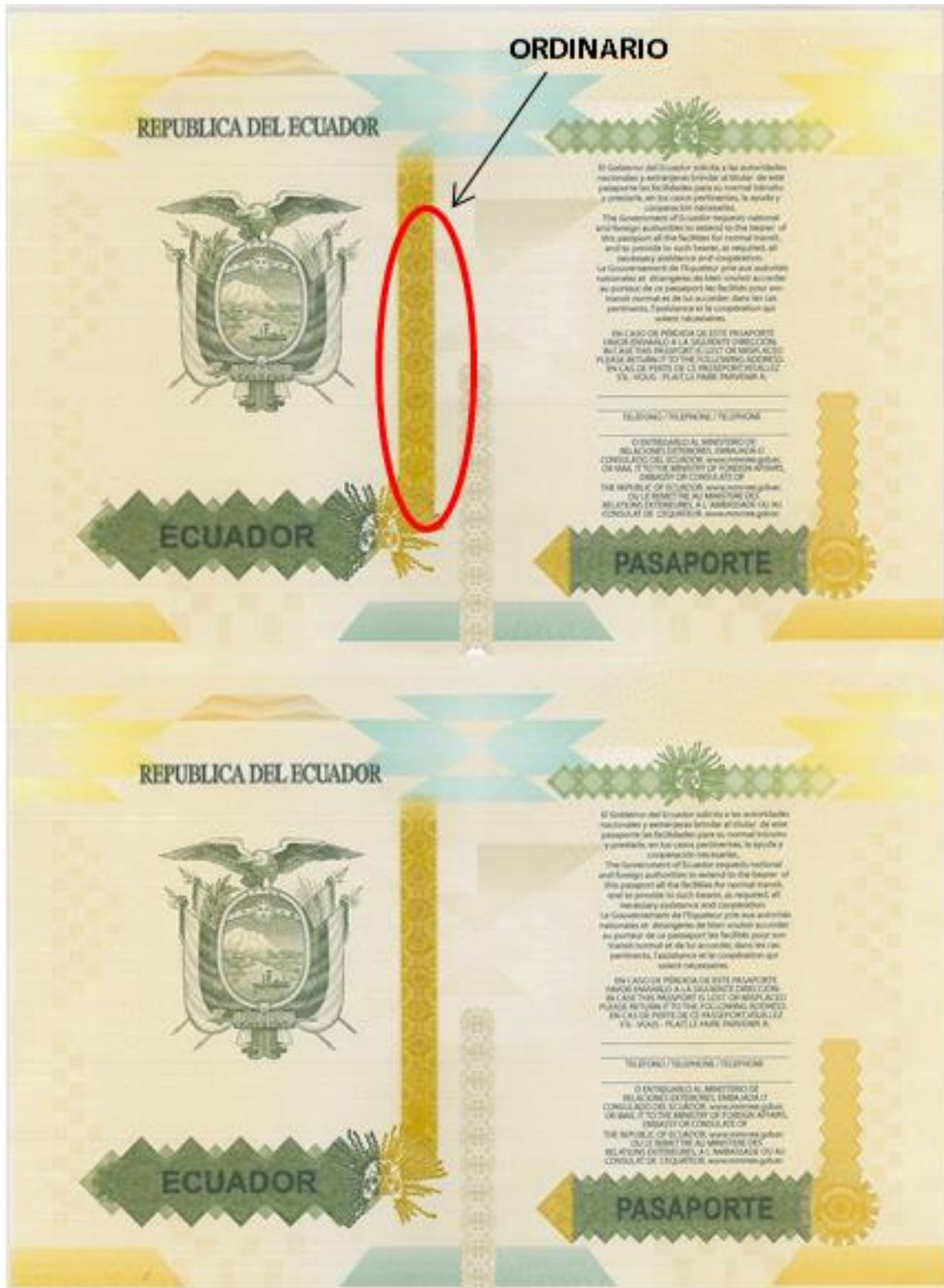
Imagen 2. Ubicación de la palabra ORDINARIO en la contratapa anterior.